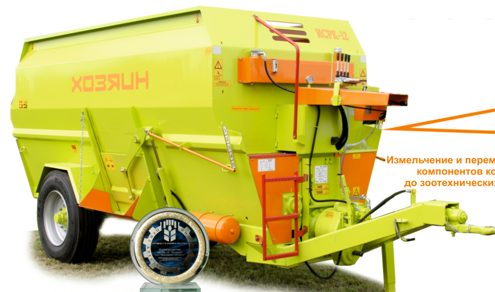
Лучшая сельхозмашина 2015 года

Измельчитель-смеситель-раздатчик кормов (ИСКРК) предназначен для приготовления полнорационной кормовой смеси (ПКС) из заданных компонентов (зелёная масса, силос, сенаж, рассыпное и прессованное сено, солома, комбикорма, корнеплоды и жидкие кормовые добавки). ИСКРК оснащен электронной системой взвешивания кормовой смеси, которая обеспечивает возможность программирования 50 рецептов из 30 компонентов.