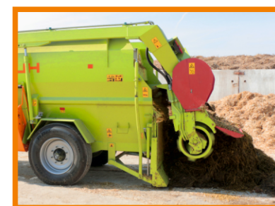
Фреза используется для самозагрузки силоса или сенажа непосредственно из мест хранения