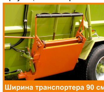
Ширина транспортера 90 см

Регулируемая высота транспортера позволяет раздавать ПКС как в кормушки, так и на кормовой стол