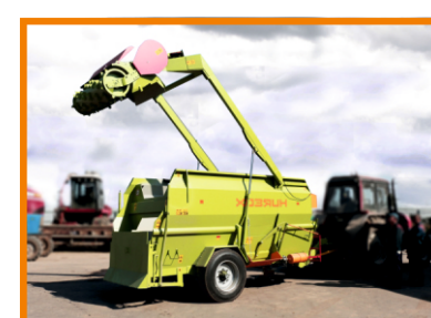
Высота загрузки фрезы до 4 м