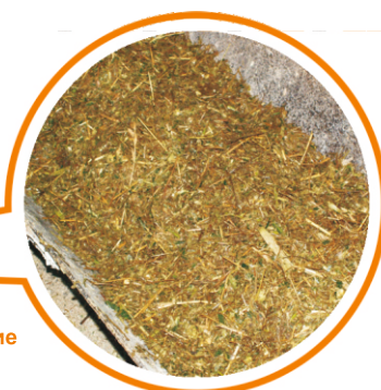
Измельчение и перемешивание компонентов корма до зоотехнических норм

Измельчитель-смеситель-раздатчик кормов (ИСКРК) предназначен для приготовления полнорационной кормовой смеси (ПКС) из заданных компонентов (зелёная масса, силос, сенаж, рассыпное и прессованное сено, солома, комбикорма, корнеплоды и жидкие кормовые добавки). ИСКРК оснащен электронной системой взвешивания кормовой смеси, которая обеспечивает возможность программирования 50 рецептов из 30 компонентов.