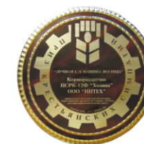
Лучшая машина для животноводства 2013 года