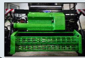
Е-313 Плющилка (1,8 м) ускоренное просушивание скошенной массы, сокращается время сушки, в результате значительно повышается качество скошенных культур