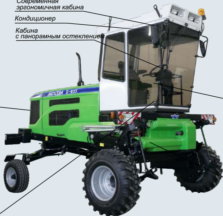
Кабина с панорамным остеклением