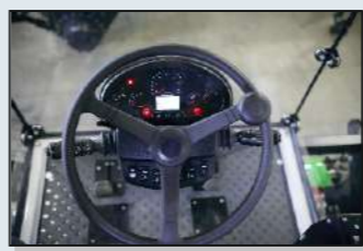
Регулируемая рулевая колонка