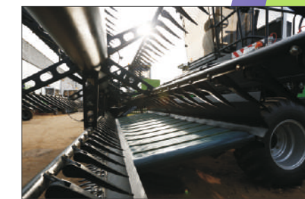
Полотняные транспортеры могут находиться в 3-х положениях: для формирования валка по центру, вправо или влево