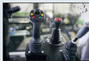
Многофункциональные джойстики управления